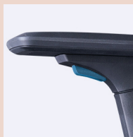
3D Adjustable armrest

FR - Accoudoir 3D, avec réglage en hauteur, profondeur et latéral.