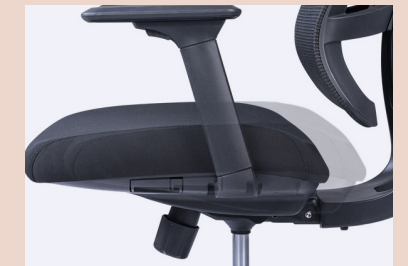
Seat sliding function

FR - Le réglage de l'assise en profondeur permet à l'utilisateur de choisir la meilleure position pour le soutien du dos, améliorant la posture et soulageant les tensions musculaires.