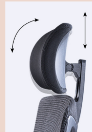
Rotation adjustment. Up and Down can be adjusted 5 cm.

FR - L'appui-tête est réglable, il répond aux besoins des différents utilisateurs et assure une posture saine. Le réglage angulaire et en hauteur est le complément ergonomique idéal pour soulager les tensions musculaires, offrant un maximum de confort.